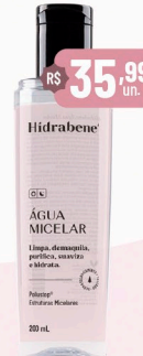
Hidrabene Água Micelar - 200ml