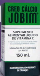
Creo Cálcio Jobim 150 mL

Indicado para o auxílio no tratamento da tosse, bronquite, gripes e resfriados. Adultos e crianças a partir de 3 anos.