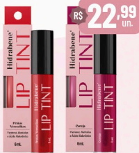
Hidrabene Lip Tint Frutas Vermelhas/Cereja - 6ml