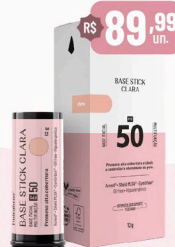
Hidrabene Base Stick Clara/Média/Escuro - 12g