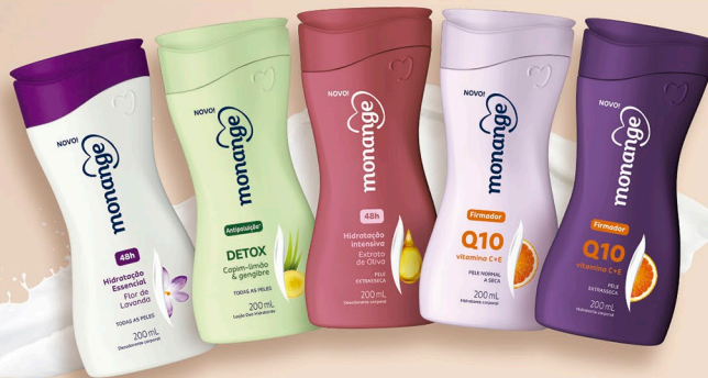
Loção Deo Hidratante Flor de Lavanda 200 ml