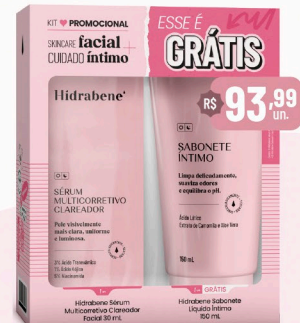
Hidrabene Kit Multicorretivo Clareador 30ml + Sabonete Intimo 150ml