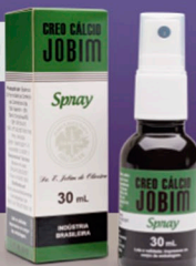
Spray Creo Cálcio Jobim 30mL

Indicado para o alívio de sintomas relacionados a gripes, faringites, laringites e afecções bucais.