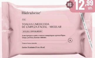
Hidrabene Toalha Umedecida de Limpeza Facial Micelar - 25 unid.